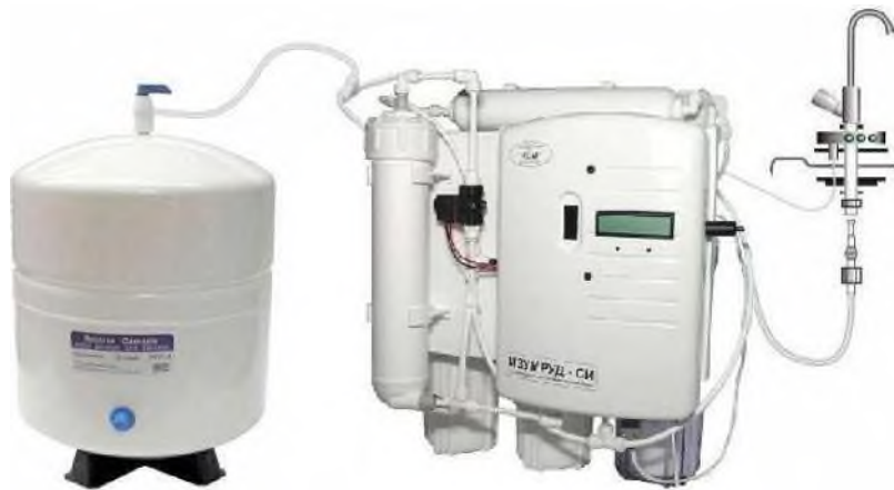
Рис. 1. Внешний вид установки "Изумруд-СИ" (мод.01 os) для получения питьевой активированной воды высшей категории качества с заданным минеральным составом и антиоксидантными свойствами.

Себестоимость питьевой воды составляет ~ 0,2 - 1,0 руб./л (мод.01 os).