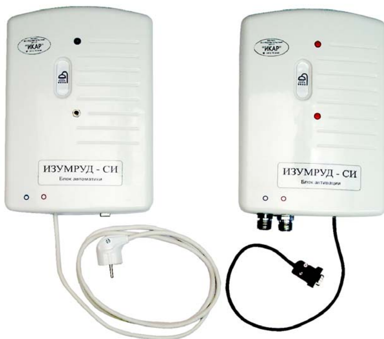
Рис. 1. Блоки активации и автоматики.