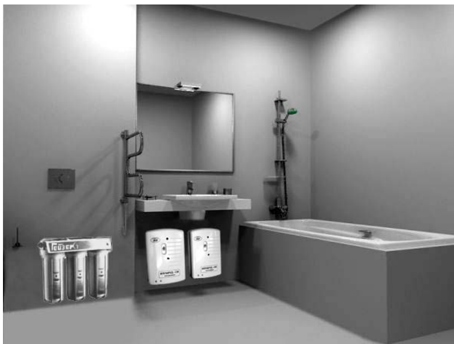
Рис. 2. Пример расположения установки в ванной комнате.